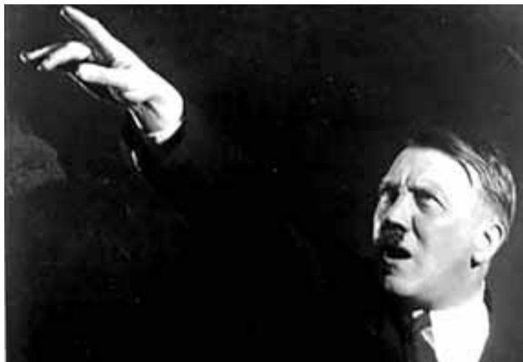
Adolf Hitler en cuatro tomas ante el micrófono con sus gestos típicos.